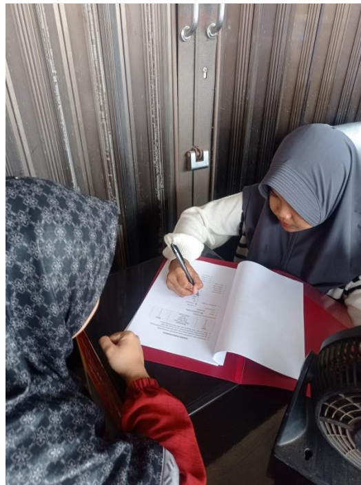
Dokumentasi Pengisian Angket