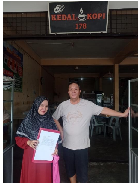
Dokumentasi Bersama UMKM