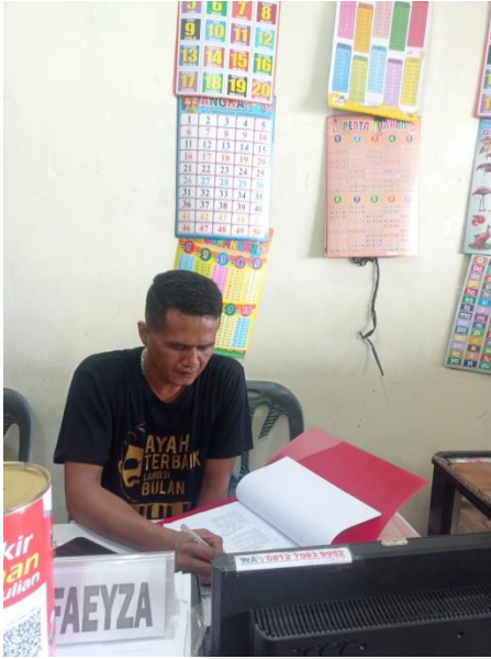
Dokumentasi Pengisian Angket