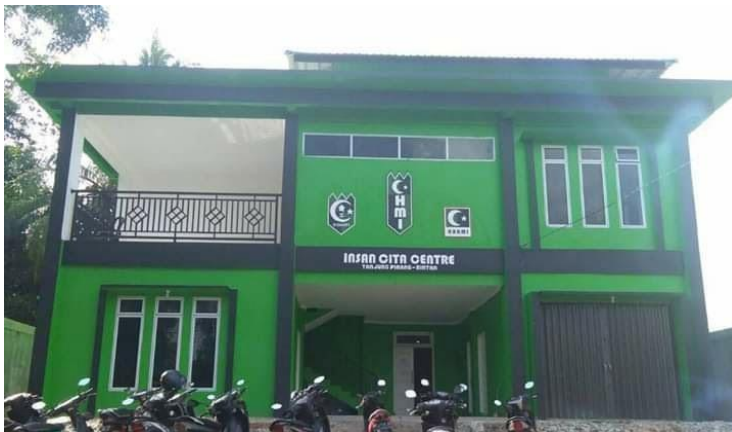
Gedung Sekretariat HMI Cabang Tanjungpinang-Bintan